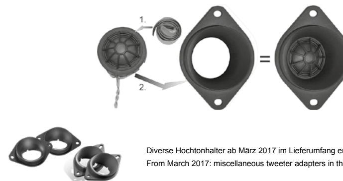
Diverse Hochtönerhalter ab März 2017 im Lieferumfang enthalten. From March 2017: miscellaneous tweeter adapters in the package included.

In some vehicles it is necessary to use the tweeter adapter which is included. If you use this adapter we recommend to stick the tweeter and adapter together with the butyl tape which is also enclosed.